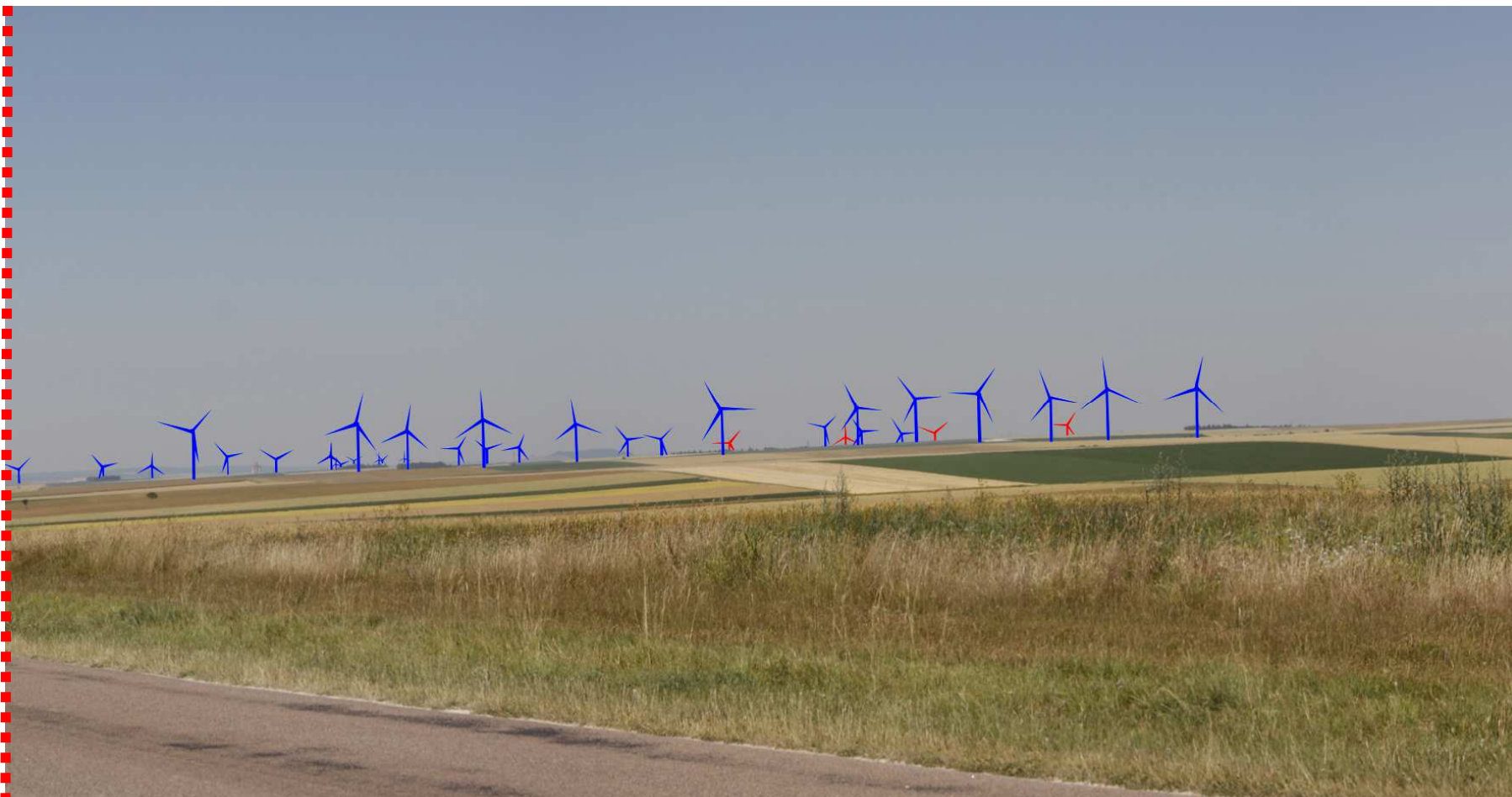
Photomontage d'interprétation recadré à 60°