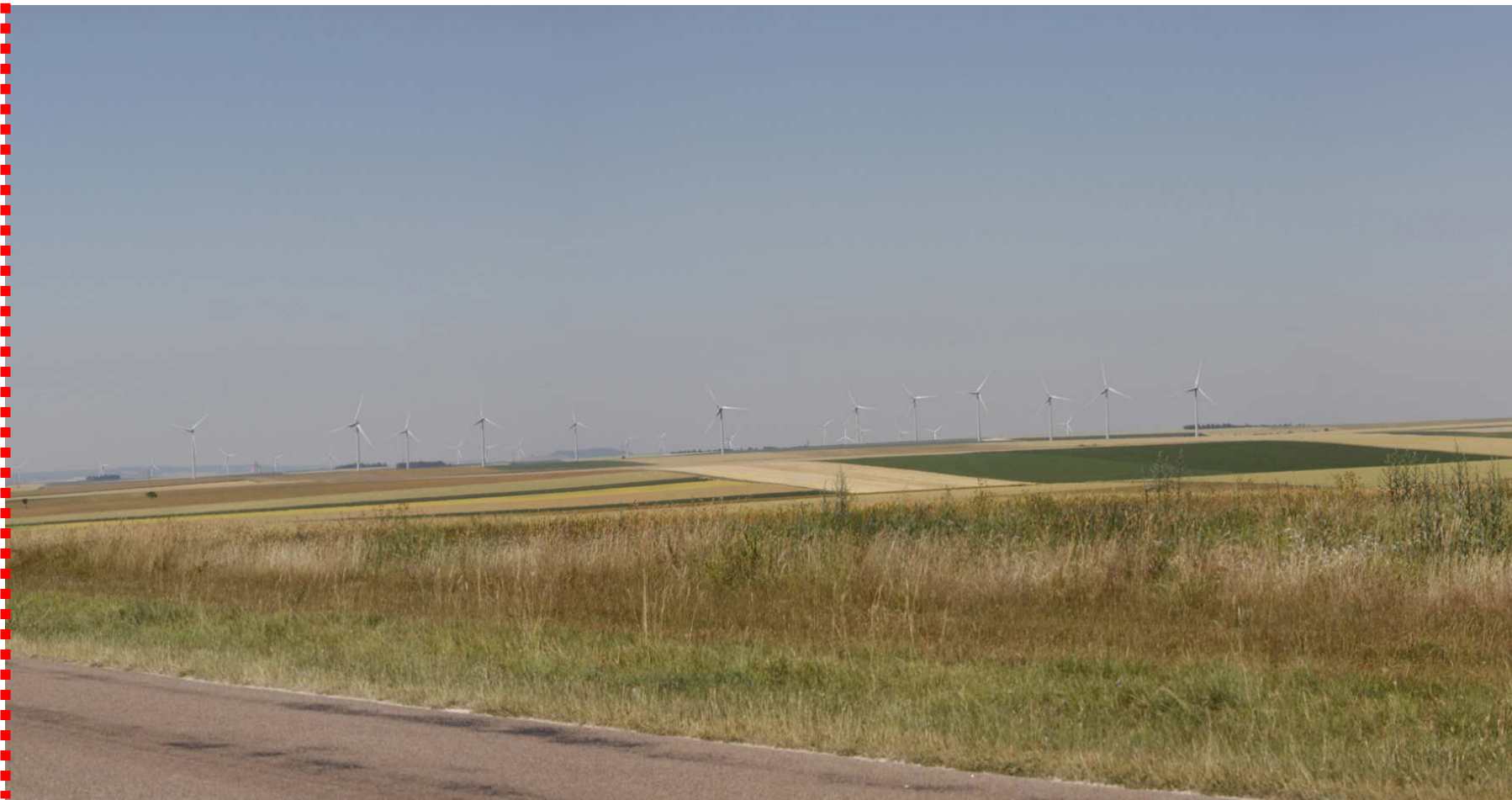
Photomontage recadré à 60°